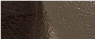
vetrofusione bronzo bronze colour fused glass