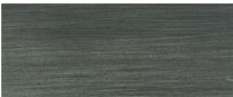
metallo brunito spazzolato a mano hand-finished burnished metal